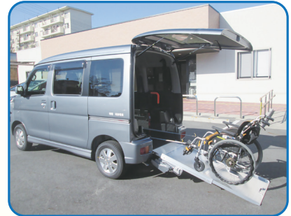
車いす対応車両貸出