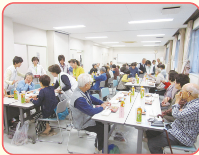
いきいき暮らしの講座