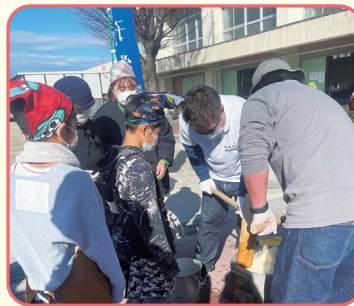
ふれあい餅つきまつり