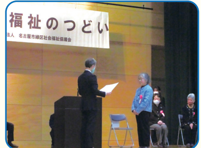
緑区地域福祉のつどい