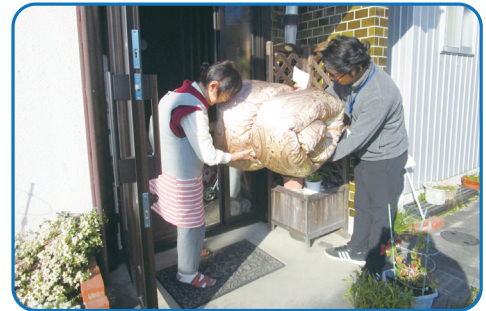
寝具クリーニングサービス事業