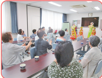
ふれあいいきいきサロン