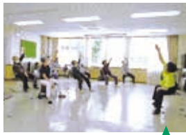
椅子に座ってストレッチ

自宅でもできるストレッチや筋トレなど、無理なく続けられる体操をみんなで一緒に取り組みます。