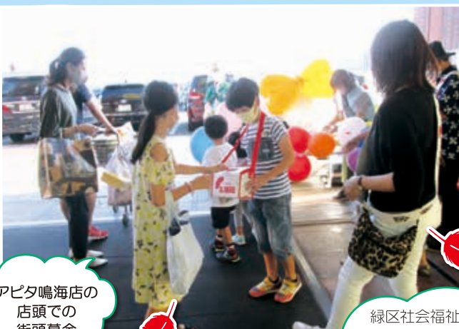
アビタ鳴海店の 店頭での 街頭募金