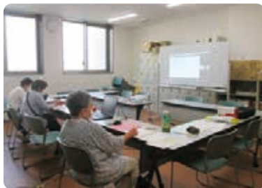
▲福祉体験学習サポーター養成講座(オンライン開催)