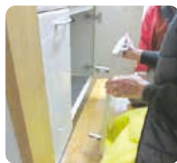
台所のドアの取り付け(小修繕)