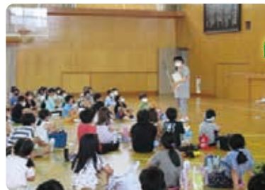
▲アイマスク(ガイドヘルプ)体験学習のようす