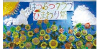
夏の創作「ひまわり畑」

季節の飾り物や毎年恒例の干支創作など、得意な人も不得意な人も自分のペースで楽しめます。