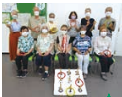
わなげ大会優勝チーム

頭や体を使ったレクリエーションやチーム対抗戦など、仲間と協力しながら楽しめます。