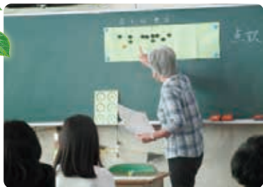
▲点字体験学習のようす