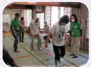
【サロン「にし」で、口腔体操やコグニサイズを指導している様子】