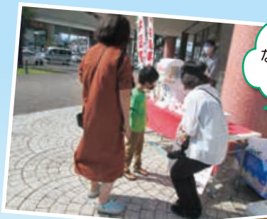
なるばーく店頭 での街頭募金