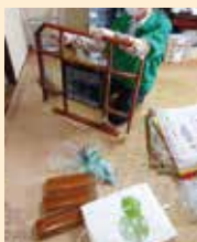
こたつは分解してゴミ袋に入る大きさに