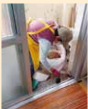
片手で持てるぐらいの土の量に小分けしてゴミ袋へ

ちょっとした困りごとをご近所の力で解決したい！ご近所ボランティアさんのその姿勢が印象に残った取材でした。みなさまも地域の助け合い活動に一步踏み込んでみてはいかがでしょうか。