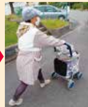
土はボランティアさん持参のキャリーカートで運搬