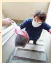
リレー方式で土を1階まで