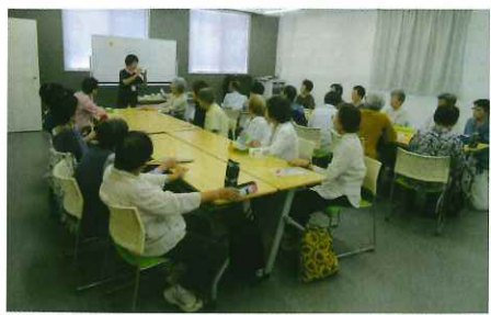
みんなで創作活動