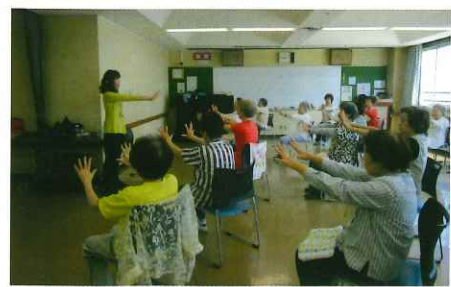
健康体操で楽しく介護予防